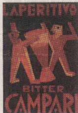
Publicité signée Depero, 1926.