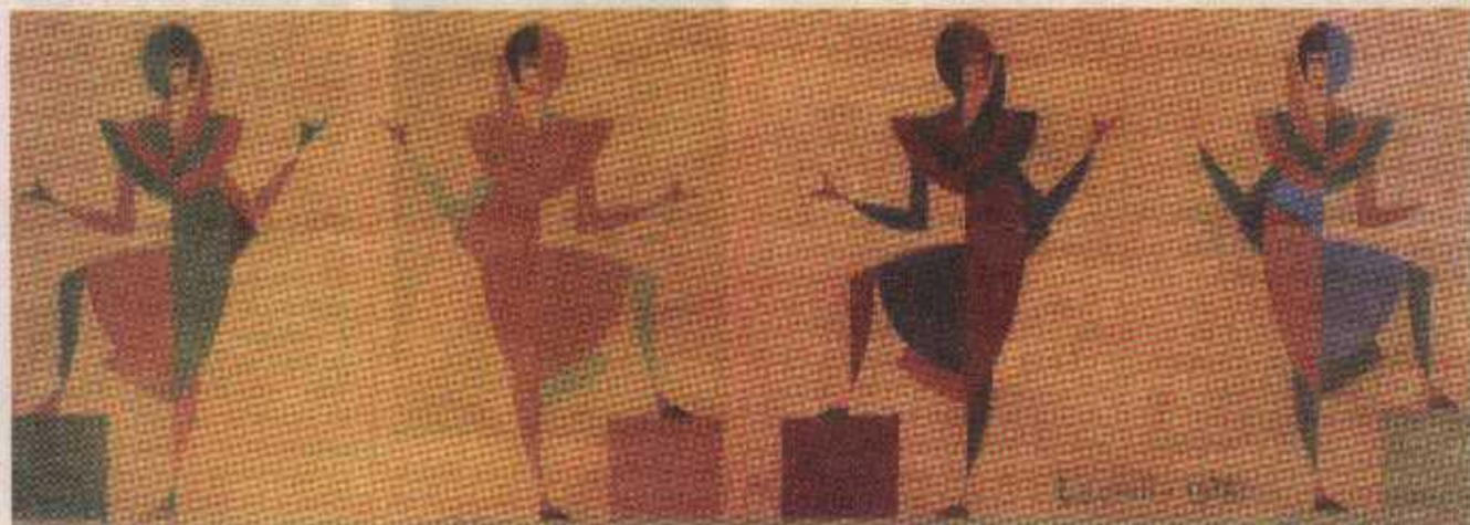
Panneau peint par Tullio Crali, 1932.