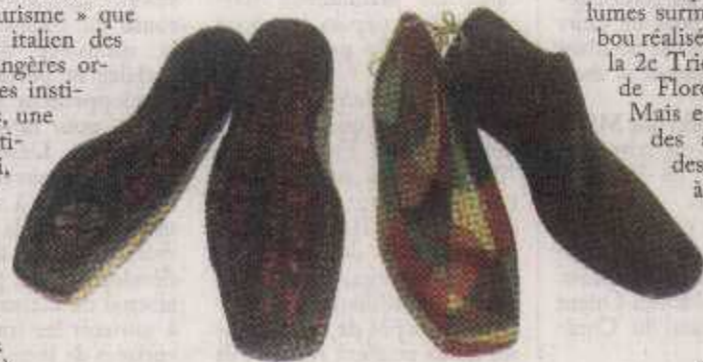
Peintures de Giacomo Balla sur moule à chaussures, 1920.

* Jusqu'au 15 juillet à la villa Audi, Centre Sofil, Achrafieh.