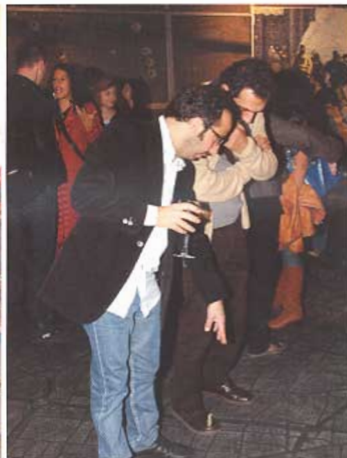
...et une carte de Beyrouth sculptée dans un tapis en caoutchouc par Marwan Rechmaoui