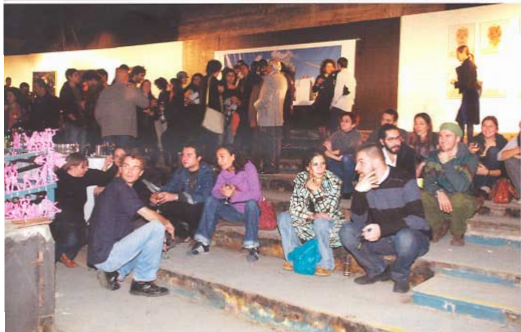
Un groupe de jeunes contemple les soldats roses de Zena El Khalil...